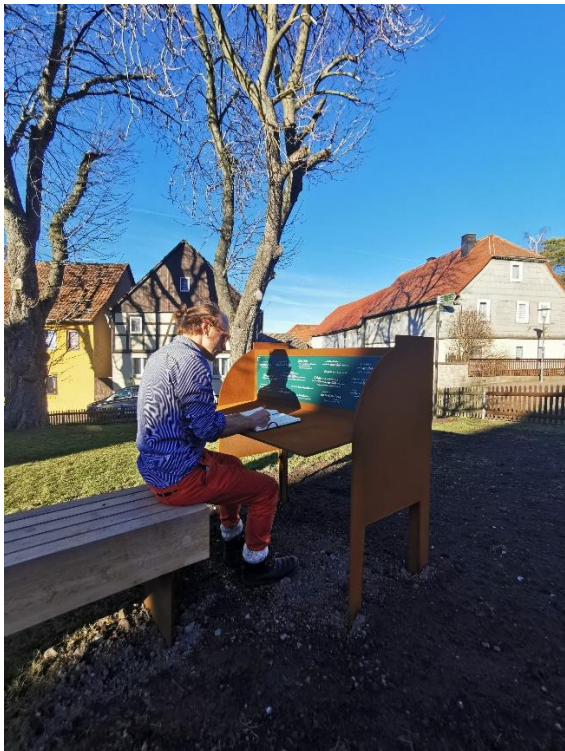
Station 7 am Goethe-Erlebnisweg