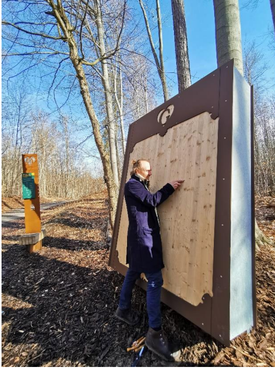
Station 4 am Goethe-Erlebnisweg