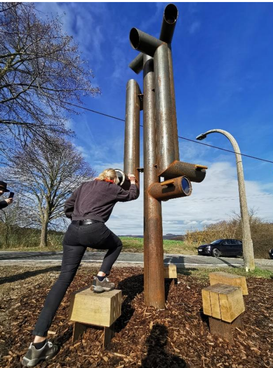
Station 5 am Goethe-Erlebnisweg